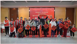
(文/活动服务部 张婕)

“全民阅读·书春日”是“书香南京”文化惠民工程的品牌项目，是全市保障弱势群体文化权益的重要举措，每逢新春在即，文化志愿者们相聚在金陵图书馆，将新一年的梦想书写于这些红彤彤、喜洋洋的对联之上，希望将这份书香祝福送去每一位读者的门楣与心间，展现新时代新气象，让全社会收获一份书香温暖、一份精神食粮。