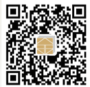
(文/采访编目部 朱晓雯)