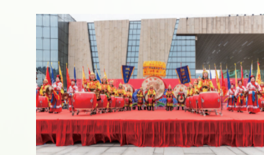
（图为江北新区民俗展演留左吹打乐专场）

切地期盼着神州大地上丰富多彩的非物质文化遗产都能得到保护传承，更要被再次创造，焕发活力、重获新生，“飞入寻常百姓家”。