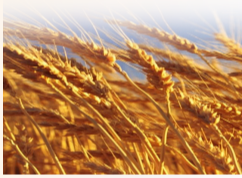
(文/宣传营销部 王斯绮)

我捧出镰刀，摸着斑斑锈迹 耳边听到奶奶说 “孩子，镰刀在奶奶心里永远闪亮” (南京诗词学会 何庆荣)